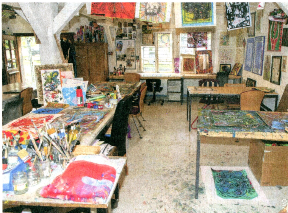
Der kreative Kosmos in der UPD Waldau, in dem Kunst entsteht.

Kulturpunkt im Progr, Bern Jeweils Do. und Fr., 14–18 Uhr und Sa., 14–17 Uhr Ausstellung bis 26.1.2024 www.kulturpunkt.ch